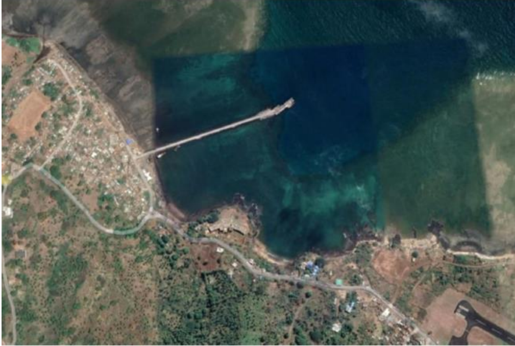
Port de BOINGOMA

La description des infrastructures existantes sera donnée plus précisément dans le Dossier d’Appel d’Offres. Il est proposé aux candidats de réaliser une visite de site dès cette phase de Sélection Initiale, afin que les candidats puissent voir l’état actuel des ouvrages existants et poser les questions nécessaires lors de cette visite de site.